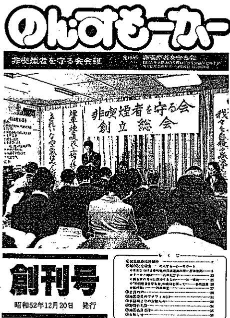
記念すべき「のん・すもーかー」 創刊号表紙（昭和52年）