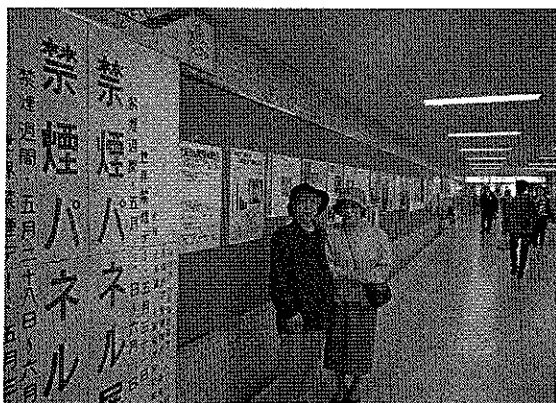
矯風会札幌支部の方々に展示をお手伝いいただきました

今年も禁煙週間(5月31日~6月6日)に各種行事が行なわれましたが、禁煙週間の目玉ともいえる禁煙パレードは、悪天候により中止となりました。楽しみにしていた方々もたくさんいらっしやったと思いますが、大変残念な結果となりました。来年は天候に恵まれることを期待したいと思います。また、当会主催の札幌地下街オーロラタウンの「禁煙パネル展」は例年通り行いました。通勤中のサラリーマンや買い物客が足を止めて見入る姿もあり、注目を集めていました。