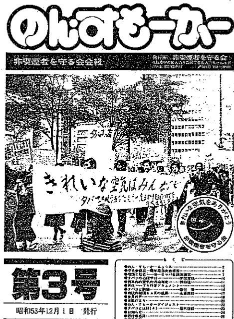
最初の禁煙パレードの様子を掲 載した第3号（昭和53年）