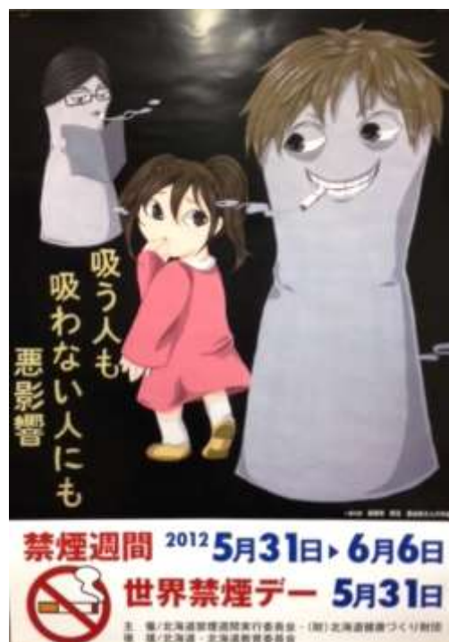
2012年度禁煙週間ポスター

1枚同封しますので、禁煙週間のPRにお役立て下さるようお願いいたします。平成24年禁煙ポスター懸賞募集要項も同封しました。締切りが迫っておりますので、お早めにご応募下さい。